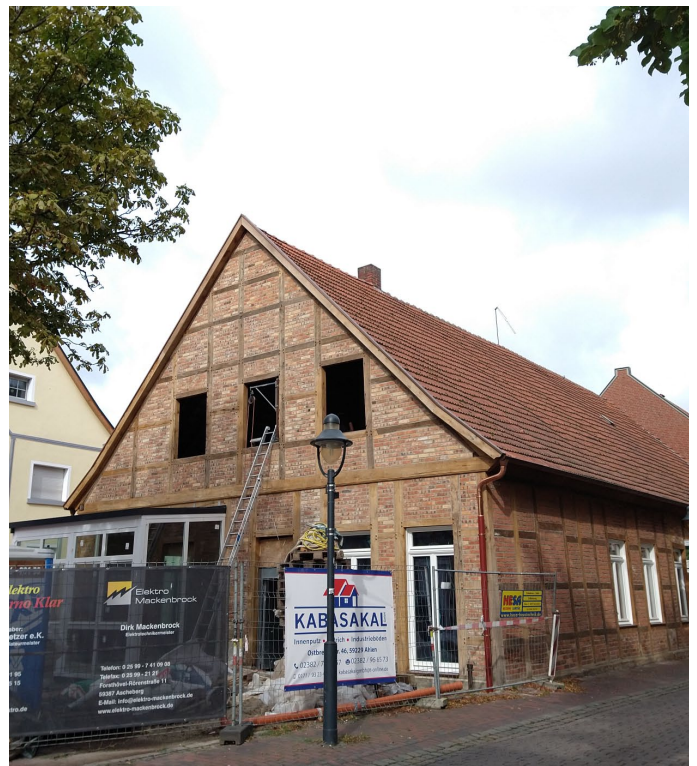
Es ist ein toller Blickfang in der Innenstadt geworden!