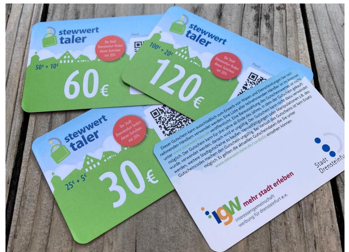
Die Sonderedition des Stewwert-Talers gibt es nur noch für kurze Zeit!

Da bereits ein großer Teil des Kontingents ausgeschöpft ist, heißt es: „Schnell sein und zugreifen!“