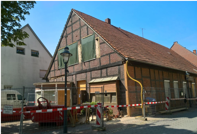
Kaum noch vorstellbar, wie das Gebäude im August 2019 ausgesehen hat.

Die Umbauten am Gebäude ehem. „Hotel zur Post“ sind fast fertig. Die Marga-Kamphus-Stiftung, die das denkmalgeschützte Gebäude an der Mühlenstraße bereits 2017 gekauft hatte, wird dort eine Tagespflege-Einrichtung eröffnen. Elke Willecke, berichtet, dass die Umbauarbeiten noch dieses Jahr beendet werden, sodass die Tagespflege zum 01.01.2021 ihre Eröffnung feiern kann.