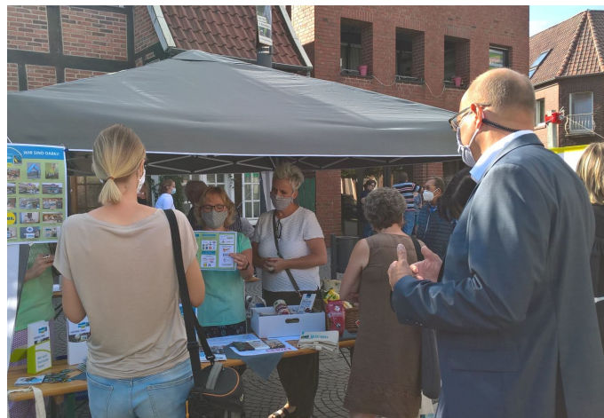
Interessierte konnten Informationen über Fairen Handel am Stand der Steuerungsgruppe einholen.