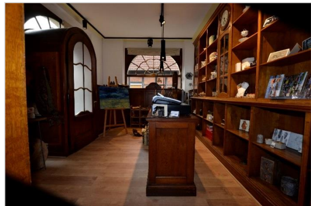
Innenansicht „m8 Galerie für Handgemachtes“

Text: Redaktionsbüro Richard Grafik und Foto: Redaktionsbüro Richard