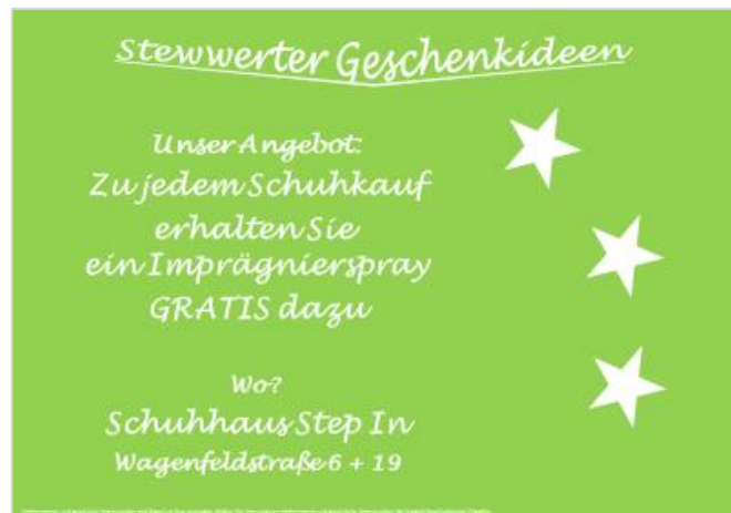
Beispiel für die Teilnahmekarte Text und Grafik: Citymanagement Drensteinfurt/IGW

1. Dezember finden Sie die Stewwerter Geschenkideen an der Ecke Wagenfeldstraße/Martinstraße. Das Reisecenter Drensteinfurt empfiehlt bspw. ein traumhaftes Wellnesswochenende für zwei Personen als Geschenktipp, der Salon Dietze sorgt mit einem weihnachtlichen Angebot für „strahlendes Haar in der Weihnachtszeit“ und in der Stadt-Apotheke gibt es besondere Angebote „für Sie“ und „für Ihn“.