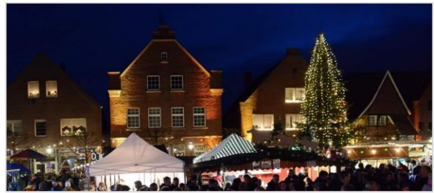
Weihnachtsmarkt in Stewwert

Noch bis zum 8. Dezember gibt es zudem die Gelegenheit Spendenchips an der Stewwerter Spendenwand einzuwerfen! Die Anteile der jeweiligen Spenden für die Vereine werden am 9. Dezember auf dem Weihnachtsmarkt bekannt gegeben!