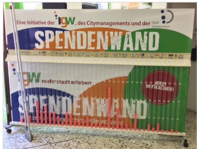
Spendenwand im Drogeriemarkt Text: IGW/Citymanagement Drensteinfurt