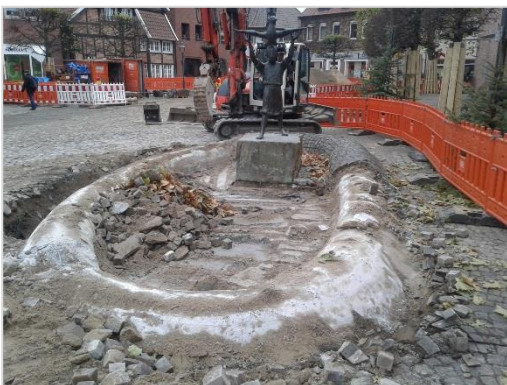
Text: Stadt Drensteinfurt

Am Marktplatz wird derzeit der Walbert-Brunnen abgebaut und eingelagert. Dadurch wird die Fläche, die den Ständen des Weihnachtsmarktes zur Verfügung gestellt werden kann, größer. Mittlerweile ist das erste Stück der Hauptwasserleitung verlegt und die Baugrube ist wieder geschlossen. Alle nicht mehr DIN-gerechten Hausanschlüsse - bis auf zwei - sind erneuert worden.