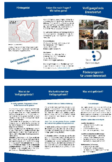
Infolyer zum Verfügungsfonds Grafik: Citymanagement Drensteinfurt

Weitere Informationen, Antragsformulare und Richtlinien erhalten Sie im Internet auf der Seite des Citymanagements unter www.drensteinfurt.de oder direkt zu den Öffnungszeiten im Citymanagement-Büro.