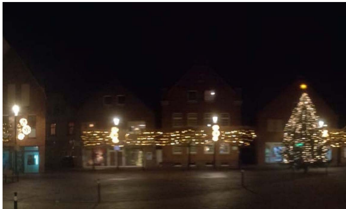
Die neue Weihnachtsbeleuchtung auf dem umgestalteten Marktplatz ist ein echter Hingucker!

Wenn am 2. Adventswochenende bereits zum 35. Mal der traditionelle Weihnachtsmarkt in der Innenstadt stattfindet, erwartet die Besucher viel Neues in der Drensteinfurter Innenstadt. Der neugestaltete Marktplatz ist vor wenigen Wochen eingeweiht worden und sorgt für ein stimmiges und barrierefreies Ambiente. Zudem hat sich die Werbebeleggemeinschaft auch mit finanzieller Unterstützung von Bund und Land insgesamt 20 Veranstaltungshütten zugelegt, die im Vorfeld festlich geschmückt werden. Zusammen mit den Holzbuden der Vereine entsteht ein kleines Weihnachtsdorf rund um die große Tanne auf dem Marktplatz.