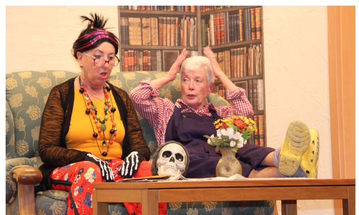
Die Schauspieler und Schauspielerinnen begeisterten das Publikum.