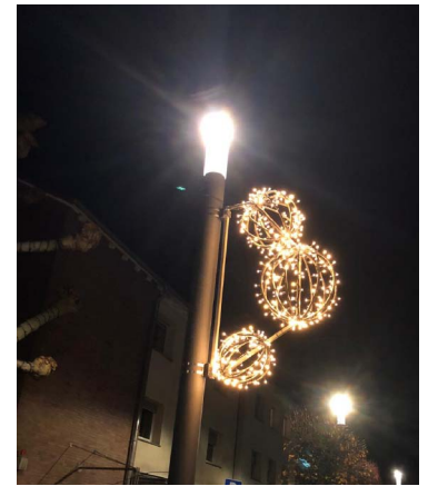
Das Besondere an der weihnachtlichen Laternen-Illumination am Marktplatz sind die drei Kugel, die das Stadtsignet Drensteinfurts widerspiegelt.