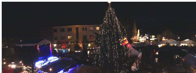
Herrlichstes Ambiente im Jahr 2018.