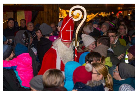
Der Besuch des Nikolauses ist jedes Jahr ein Highlight!