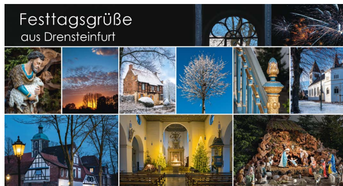
Die neue Karte „Festtagsgrüße aus Drensteinfurt“ 2019.