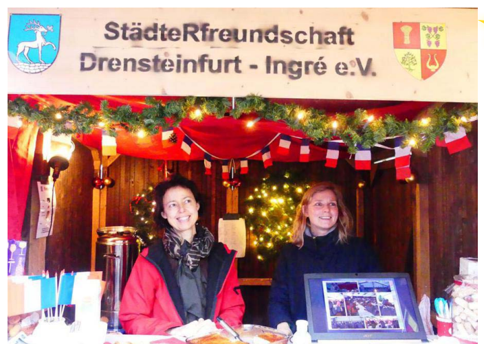
Bereits im letzten Jahr gab es einen Stand des Vereins „Städtefreundschaft Drensteinfurt - Ingré“.