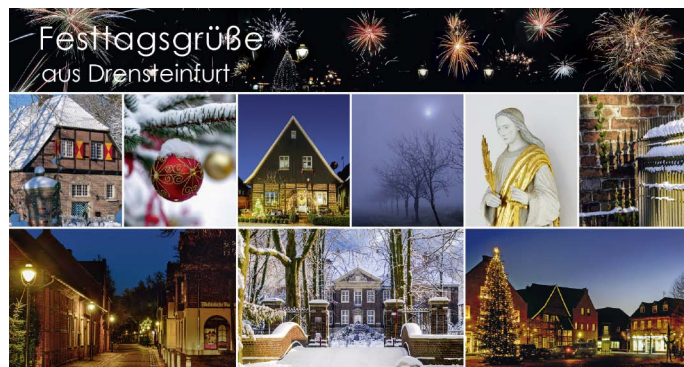
Die Festtagskarte 2018 aus Drensteinfurt.

Die neue Festtagskarte ist erhältlich bei: » der m8 Galerie für Handgemachtes, » der Bücherecke, » der Postagentur, » Markt Nr. 1, » der Stadtapotheke.