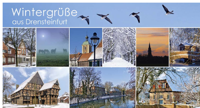
Die neutrale Winterpostkarte aus Drensteinfurt.