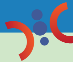
Carsten Grawunder Bürgermeister

Bitte nutzen Sie das reiche Angebot an Veranstaltungen zum Thema Artenvielfalt in diesem Kalender und tragen damit dazu bei, dass sich die Stadt Drensteinfurt in Zukunft im Sinne einer naturnahen und umweltfreundlichen Kommune deutlich weiterentwickelt.