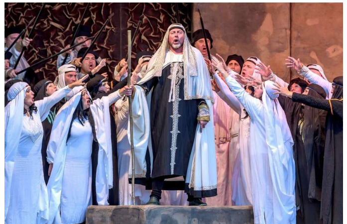
Die Oper Nabucco wird 2021 auf dem Marktplatz in Drensteinfurt stattfinden

Aufgrund der aktuellen Lage wurde die Veranstaltung NABUCCO am 15.08.2020 auf dem Marktplatz in Drensteinfurt abgesagt. Das Veranstaltungsbüro sowie die Stadt Drensteinfurt freuen sich, dass mit Samstag, 28.08.2021, ein Ersatztermin gefunden werden konnte.