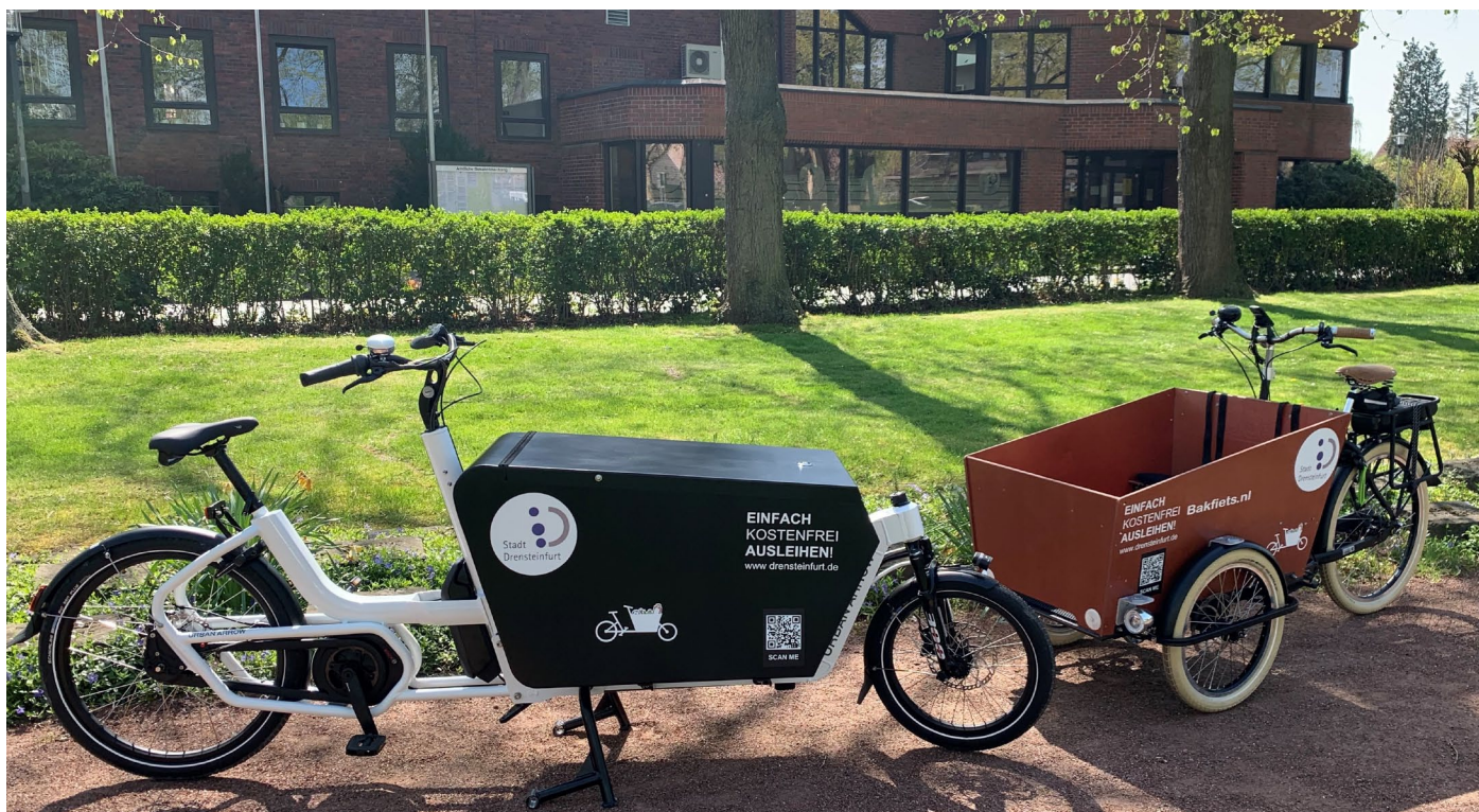
Die beiden Lastenfahrrad-Modelle bieten viel Stauraum!

finden Sie auf der Homepage www.drensteinfurt.de/lastenraeder