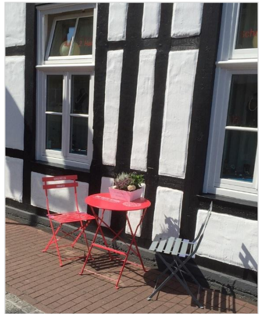
Die bunten Tisch-Stuhl-Kombinationen wirken auch im Fachwerk-Ambiente einladend.

Die neuen Artikel können voraussichtlich bereits zum Summer Feeling aufgestellt werden.