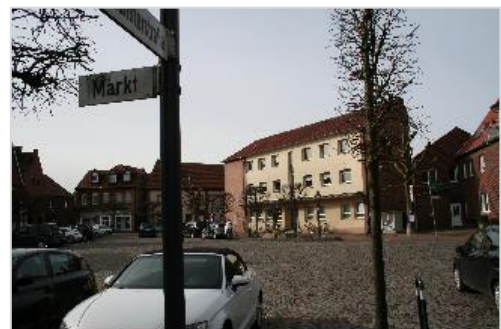
Schon bald sieht es hier ganz anders aus: Der Marktplatz Drensteinfurt Text und Foto: Citymanagement Drensteinfurt

Auch für die neuen Laternen ist eine Entscheidung gefallen: Gleiches Modell, schlankere Ausführung. Der integrierte Wasseranschluss in den Laternen wird nicht mehr benötigt, da eine andere Lösung für einen Wasseranschluss auf dem Marktplatz gefunden wurde. Vorrichtungen für das zukünftige freie WLAN in der Innenstadt bleiben aber in den Laternen enthalten!