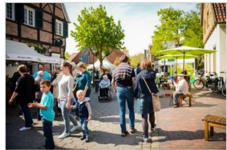
Impression vom Summer Feeling 2017

Seit 2003 ist das zweijährig stattfindende „Summer Feeling“ neben dem Dreingaufest das zweite große Event in der Drensteinfurter Innenstadt. Bevor im Mai 2019 das nächste „reguläre“ Summer Feeling steigt, gibt es dieses Jahr das „Summer Feeling mal anders“: Der Spielmannszug Grün-Weiß Drensteinfurt feiert sein Jubiläum und hat Spielmannszüge aus den Nachbarstädten zu einem Sternenmarsch durch Drensteinfurt eingeladen. Auf dem Marktplatz wird der Maibaum aufgestellt und natürlich gibt es auch Verkaufsstände, ein Programm für die Kinder sowie Speisen und Getränke. Der Sonntag ist zudem verkaufsoffen. Weitere Infos gibt es auf der Internetseite der igw unter http://www.igw-drensteinfurt.de