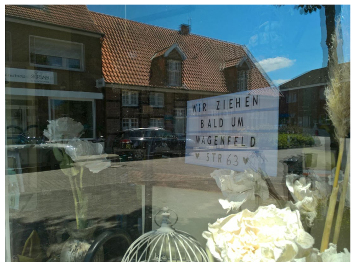
Die Kundinnen und Kunden können gespannt bleiben, wie die neuen Räumlichkeiten eingerichtet werden.