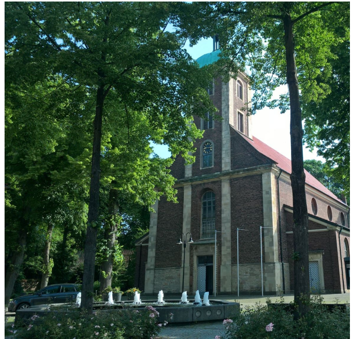
Der St. Regina Kirchplatz bekommt ein neues Wasserspiel.

Ausgenommen ist der Donnerstag, da an diesem Tag der Wochenmarkt stattfindet.