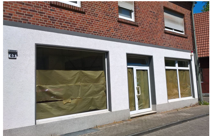
Da tut sich etwas in der Wagenfeldstraße 63!

Vielen Dank, dass Sie sich die Zeit für das Interview genommen haben!